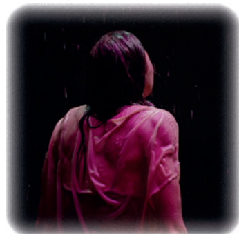
© Charlotte De Cort en Jordan Vanschel

(2023, short film) and the role of the director. Charlotte De Cort, Shauni De Gussem & guests